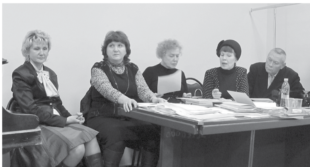
Руководители секции «Поэзии»: